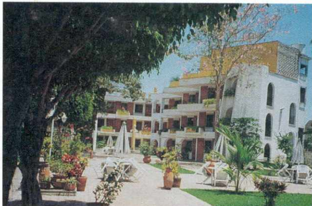
La tranquilidad (42 habitaciones) y el servicio del hotel son una garantía.