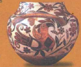
Cerámica policromada de «Acoma Pueblo».

Conoceremos las culturas fundadoras de las Naciones de los Indios Pueblo: los Hohokam, los Mogollón y los Anasazi.