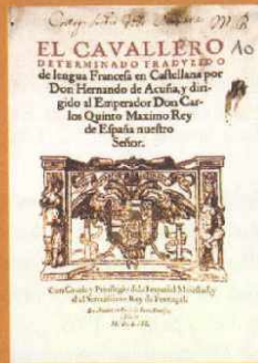
«El Caballero Determinado» traducido del francés por el emperador Carlos V.