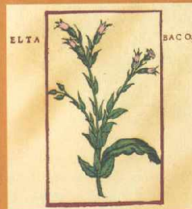
El tabaco: planta medicinal muy antigua conocida por los indios de Nueva España. Doctor N. Monardes (1574)

Se estudiará la «Agricultura Viajera» y los actuales cultivos de la comarca de La Vera procedentes de América: el tabaco y el pimiento.