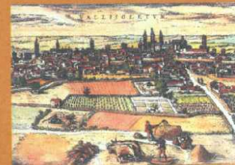
Detalle de Valladolid en el grabado «Civitates orbis terrarum».

En el Real Monasterio de Santa Clara será recordada con una conferencia, «La Rebelión de las Comunidades de Castilla y la Junta Santa».