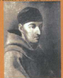
Retrato de Fray Bernardino de Sahagún. (1500-1590)