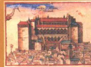
El Alcázar de Toledo. Detalle de un grabado anónimo. (1598)

Los banqueros de Ausburgo (los Fugger) serán objeto de nuestro estudio, así como el retiro del Emperador al Monasterio de Santa María de La Sisa después de la muerte de la Emperatriz Isabel. En el Alcázar, se impartirá una conferencia sobre Toledo Ciudad Imperial y escucharemos un concierto interpretado en el órgano del Emperador, en la Catedral.