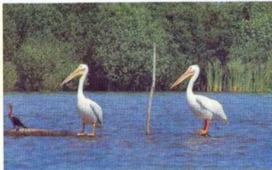
Pelicanos en los manglares

Un sitio más para visitar es Zoquilpan. Para llegar a este espectacular lugar es necesario trasladarse al embarcadero "El Conchal", también a cinco minutos de San Blas. Esta ruta ofrece un espectáculo estilo Hollywood, es decir: con final espectacular, pues el recorrido resulta muy agradable, con observación de aves, pero hay un momento, justo al final del mismo, que es como llegar a un paraíso terrenal, ya que ante nosotros se posa una visión simplemente magnífica: una laguna grande con una isleta en medio, cuyos pobladores son cientos de aves, principalmente